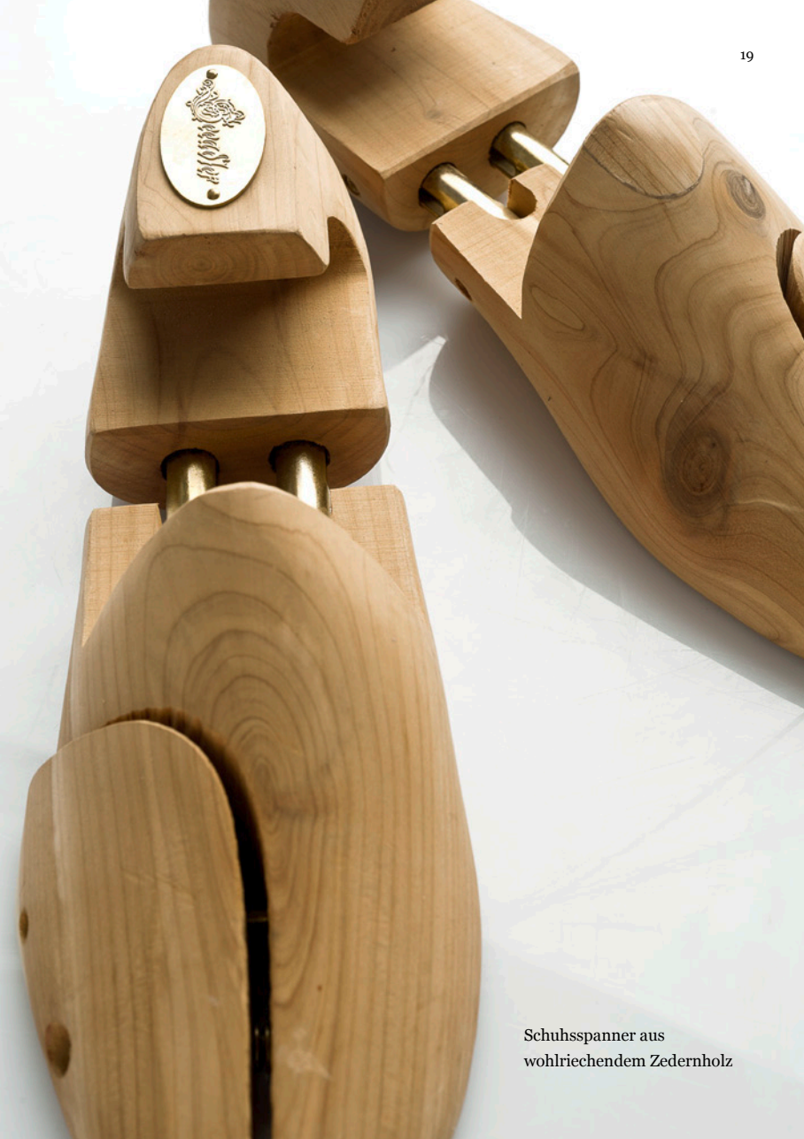
Schuhsspanner aus wohriechendem Zedernholz