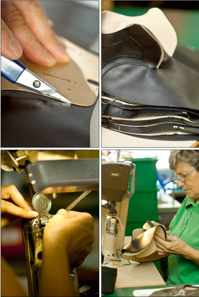
Einblicke in die Fertigung