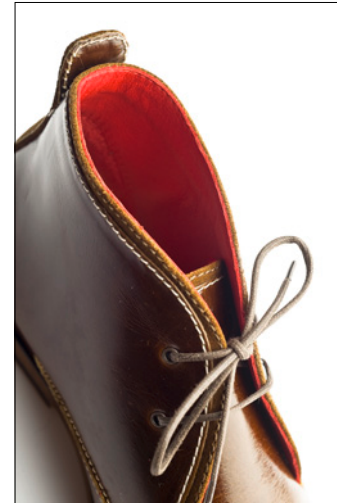
Ganz besonders: Desert-Boot mit rotem Lederfutter

Ausgewählte Ledermanufakturen aus Deutschland