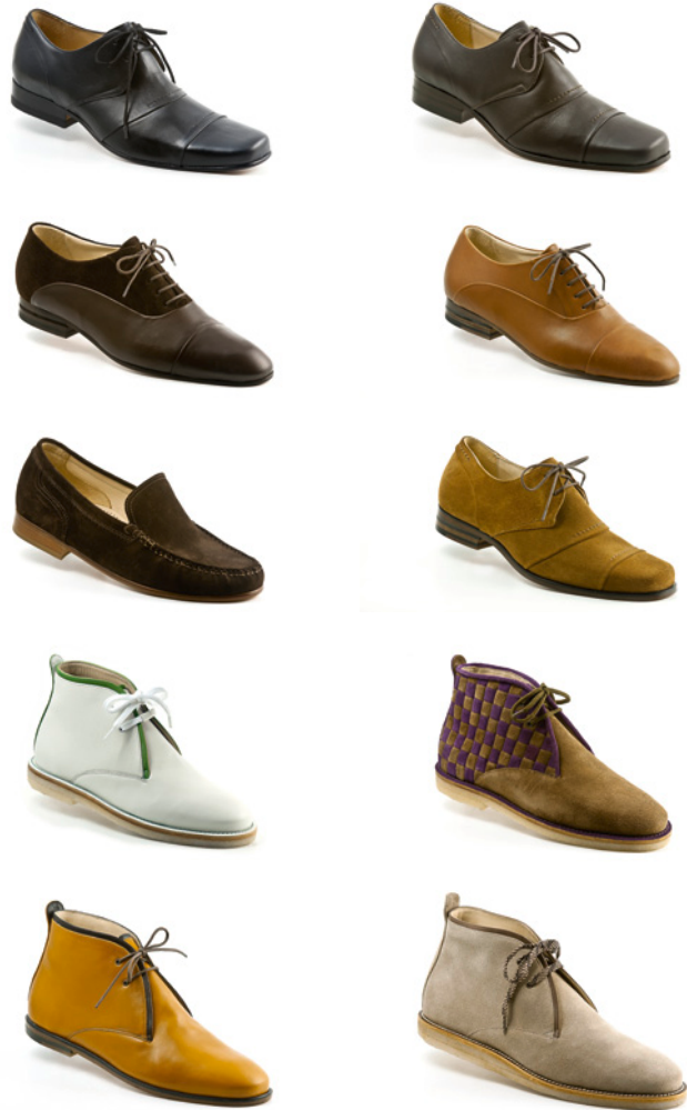
Schuhmodelle: eine Auswahl aus der Palette der Möglichkeiten